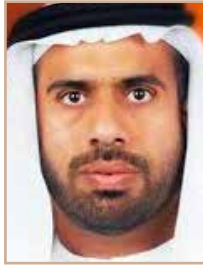
سعادة الأستاذ/ مصباح سعيد بالعبيد الكتبي نائب رئيس المجلس