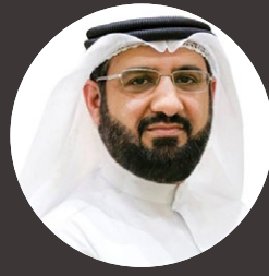
بقلم/ عادل المرزوقي كاتب ومدرب معتمد لتقديم برامج الكوتشنج