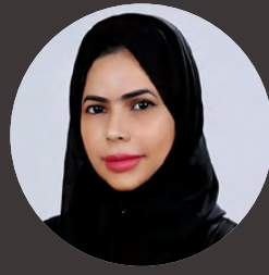
بقلم/ فاطمة المرزوقي كاتبة إماراتية