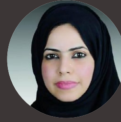
بقلم/ فاطمة المزروعى كاتبة إماراتية