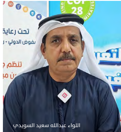
اللواء عبدالله سعيد السويدي