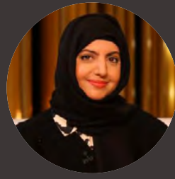
بـقلم / م. مريم البلوشي