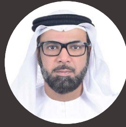
بقلم / أحمد محمد الشحي