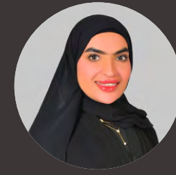
بقلم سعاد الشامسي مدير جائزة الشارقة للعمل التطوعي