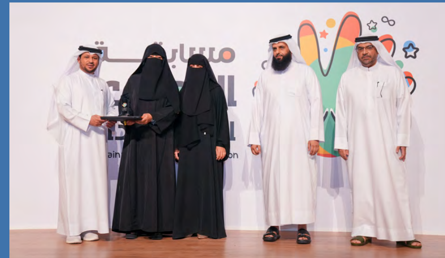
المركز الثالث مدرسة البردي للتعليم الأساسي

وأضافت أن مسابقات المدارس يُشترط المشاركة فيها؛ أن تكون الجهة أو المدرسة في الدولة ومرخصة ومسجلة من الجهات المختصة، وأن يكون العمل الذي يتم المشاركة به خلال الفترة المحددة.