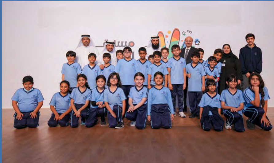
المركز الثاني مدرسة تريم الأمريكية الخاصة