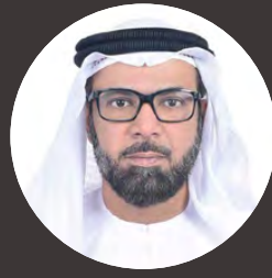
بقلم/ أحمد محمد الشدي كاتب إماراتي