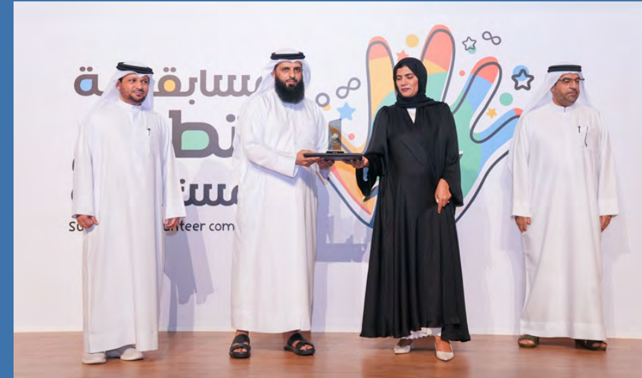
المركز الثاني روضة ند الحمير