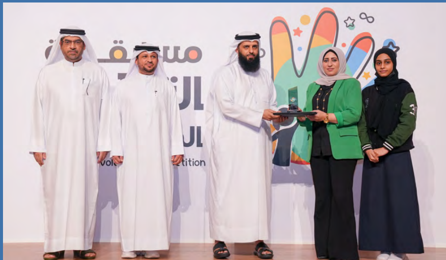
المركز الثالث مدرسة الشعلة الخاصة

وأضافت المخلصة في الحصول على هذا المركز، وأضافت أن مدرسة المعرفة الدولية، تحرص على تعويد أطفالنا في المدرسة بأهمية العمل التطوعي بشتى أنواعه فضلاً عن مساهمة أولياء الأمور في تعزيز التوعية لدى الأطفال والسماح لهم بالمشاركة في الاعمال التطوعية.