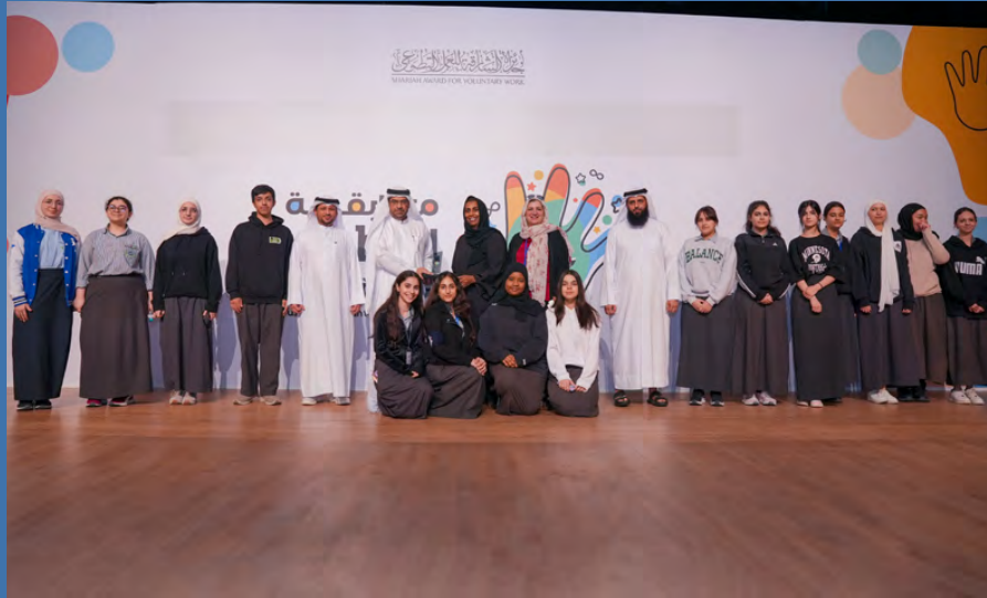
المركز الأول مدرسة المعرفة الدولية الخاصة