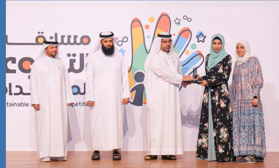
المركز الاول مدرسة النوف الحلقة الثانية